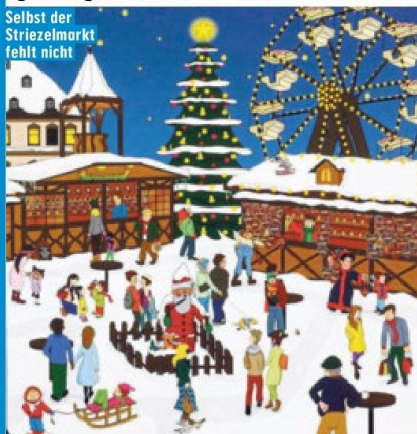
Selbst der Striezelmarkt fehlt nicht